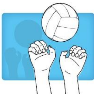
"Tiger" Fingers spelen met de knokkels