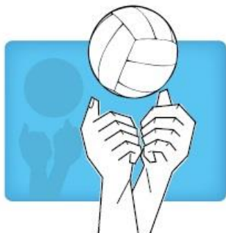
Overhand two handed "punch" twee handige stomp