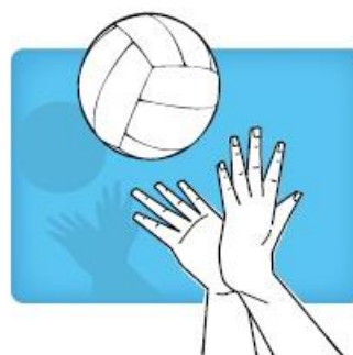
"Gator" hit krokodillen techniek