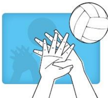
Overlapping hands overlappende handen