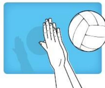
Chopping two handed action twee handige hak beweging